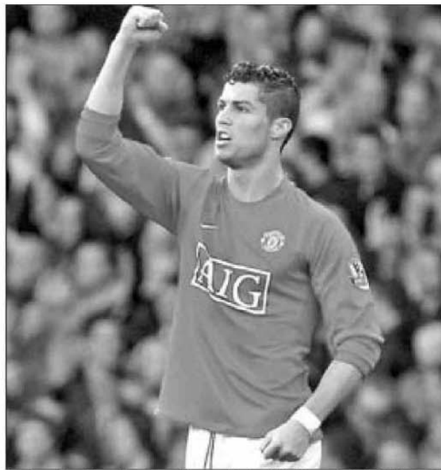
Cristiano Ronaldo celebra un gol frente al Aston Villa el pasado 5 de abril.