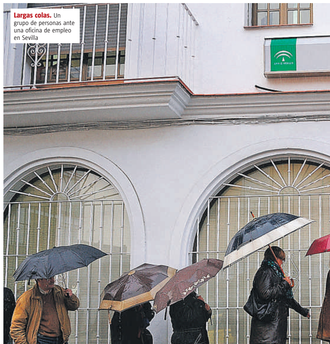
Largas colas. Un grupo de personas ante una oficina de empleo en Sevilla

Sobre las políticas empresariales, el profesor de Esade considera que no se han planteado de forma adecuada “las ayudas al circulante de las empresas”. Y eso es peligroso, concluye, porque muchas compañías acaban quebrando por falta de liquidez.