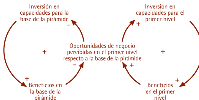
Figura 2. La BDP: una profecía que se autoalimenta

Tradicionalmente, las empresas han ignorado a la BDP al considerar que en la misma no existen oportunidades de negocio. Por tanto, sus estrategias, modelos de negocio, inversiones y productos han estado dirigidos a la cúspide de la pirámide socioeconómica mundial. Dado el papel fundamental que la empresa desempeña en el desarrollo social, su percepción sobre el potencial relativo de los mercados con alto poder adquisitivo y de la BDP ha contribuido a incrementar la distancia entre ambos. Las Figuras 2 y 3 explican este fenómeno desde una perspectiva sistémica.