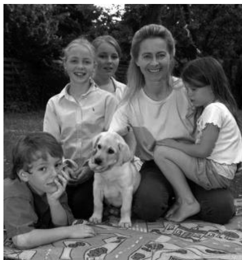
Una foto familiar de Ursula von der Leyen

Ciertamente ha acentuado esta influencia. Pero, al mismo tiempo, algunas empresas reconocen que cuando se buscan jóvenes con una buena formación, hay que prestar atención también al deseo de tener hijos de estas personas. Las aptitudes de liderazgo –capacidad de trabajo, de organización, sentido de responsabilidad– se adquieren fundamentalmente, no en la profesión, sino en la familia y en cargos no remunerados. Una empresa que quiera cultivar talento directivo que sea al tiempo humanamente interesante, debería preocuparse de que esas personas tengan tiempo y lugar para ser también padre o madre.