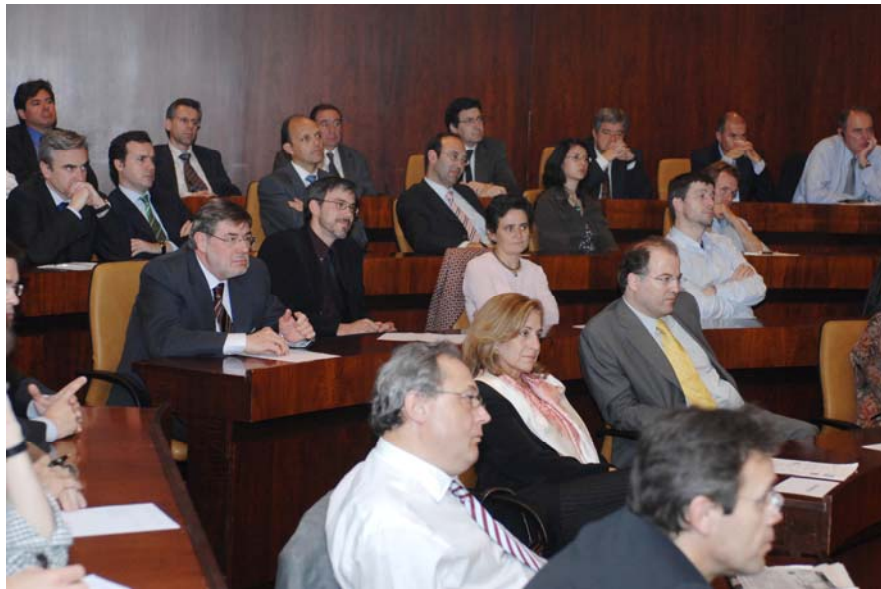
Asistentes a los Foros de Regulación y Competencia, celebrados durante los meses de abril y mayo de 2007.