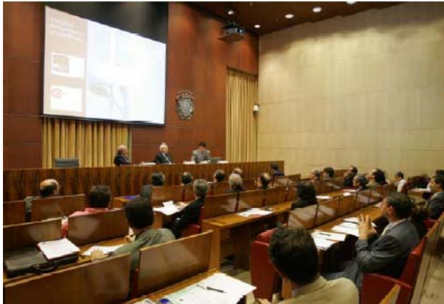
La casa Llotja de Mar fue el escenario del VI Coloquio