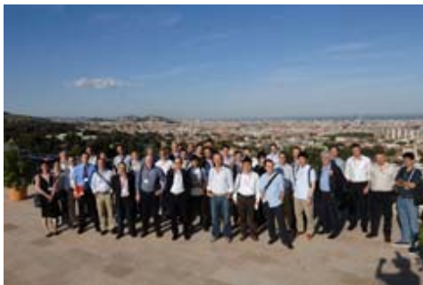
Foto de familia de los participantes en la Conferencia

La Conferencia reunió a buena parte de los mejores expertos internacionales con sus últimos estudios teóricos y empíricos en materia de finanzas internacionales, política monetaria, macroeconomía, microeconomía de mercado y organización industrial, entre otros.