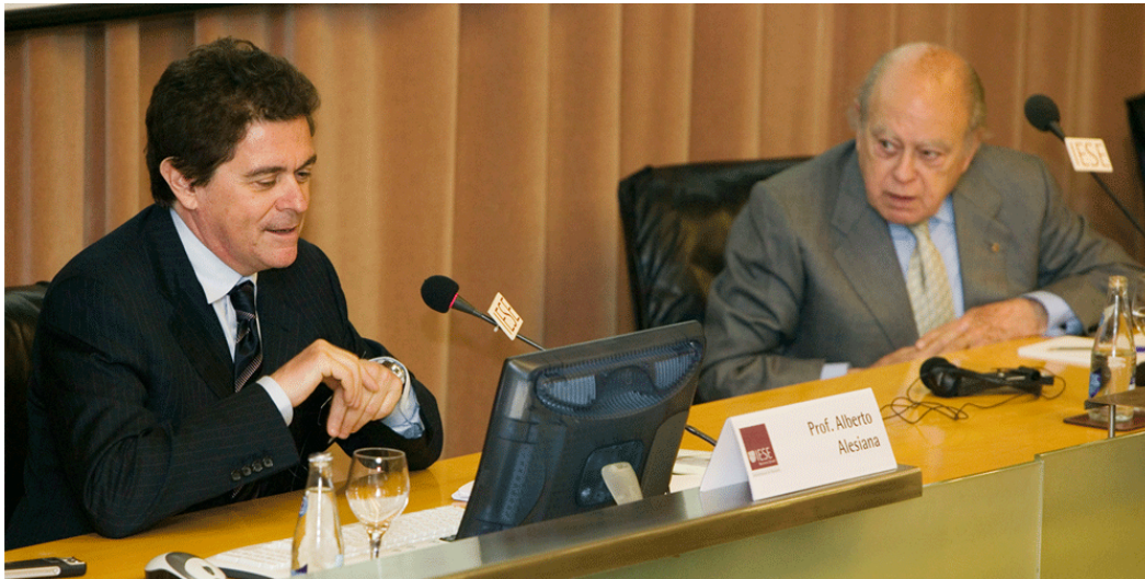
Alberto Alesina, profesor de Economía política de la Universidad de Harvard y Jordi Pujol, ex presidente de la Generalitat de Catalunya

Durante el IV Foro de Regulación y Competencia, Alberto Alesina explicó que tras el milagro económico que duró aproximadamente de 1945 a 1975, el crecimiento europeo se ralentizó drásticamente en la década de los '80 y aún no se ha recuperado del todo. Su libro, The Future of Europe , aporta soluciones que pasarían por una serie de reformas consistentes en liberalizar bienes y servicios, reducir el estado de bienestar, incentivar la investigación y el mundo universitario, reducir las barreras de entrada y mejorar la justicia social, entre otras. Por su parte, Jordi Pujol afirmó que la clave del decrecimiento europeo actual es la situación acomodaticia en la que se han instalado las potencias europeas motivo por el cual ha perdido también iniciativa y peso en el mundo.