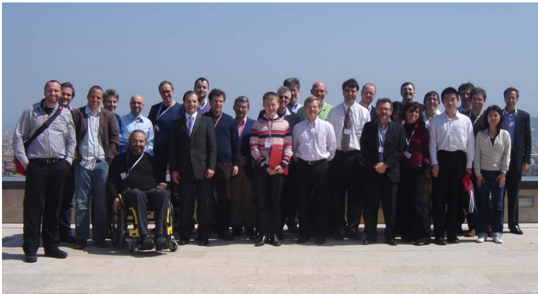
Foto de familia de los participantes en la conferencia

Organizado conjuntamente con el Centre for Economic Policy Research (CEPR) y patrocinado por la Comisión Europea en el marco de los Programas Marie Curie, el Centro Sector Público – Sector Privado celebró la 2ª conferencia del programa " Privatization, Partnership and Public Service Delivery " (PPPSD) los días 4 y 5 de Abril en Barcelona.