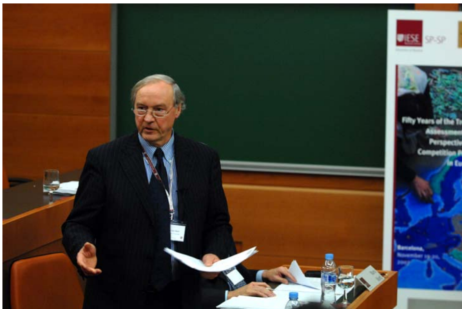
Karel van Miert, ex Comisario Europeo de Competencia y Presidente de la Nyenrode Business Universiteit