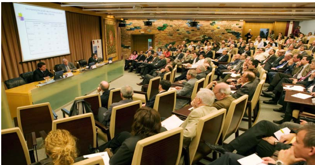
Foto de los asistentes al IV Foro de Regulación y Competencia: El futuro de Europa