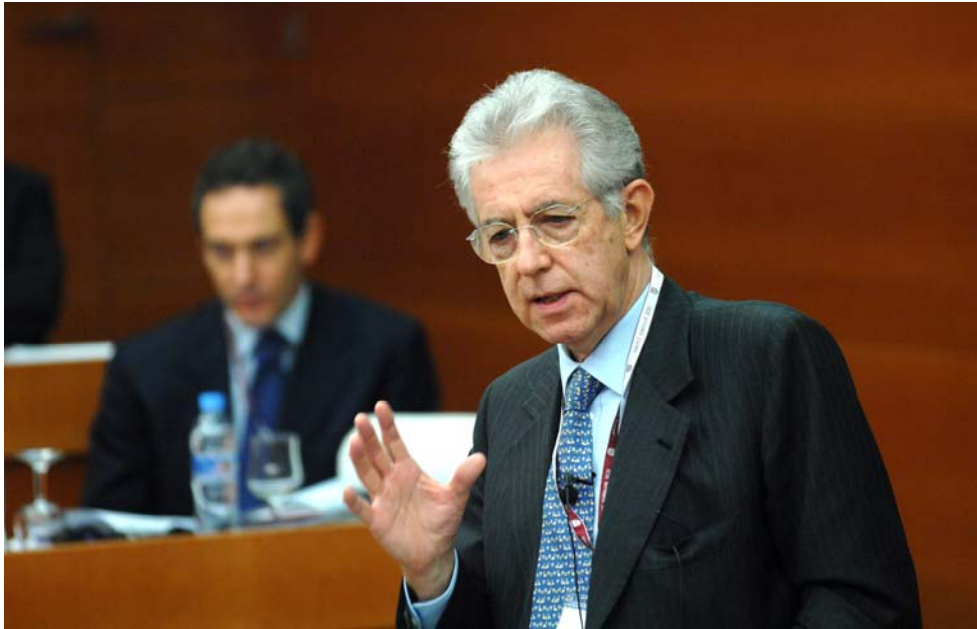
Mario Monti, Presidente de la Universidad Bocconi y ex Comisario Europeo de la Competencia