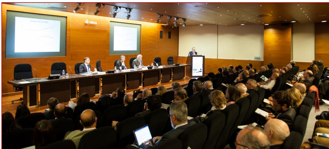
Presentación V Reform Monitor PPSRC, 14/04/2016