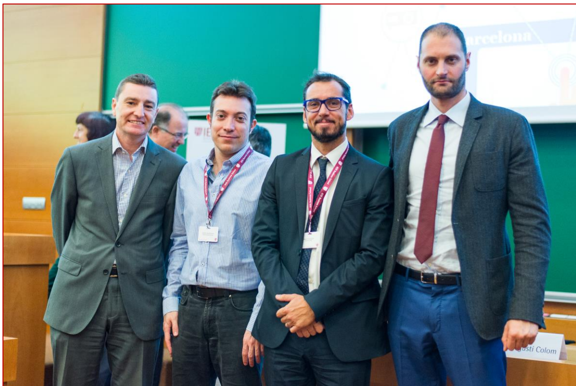
XV Coloquio PPSRC, 22/06/2016

Profesor de Finanzas, CASS Business School