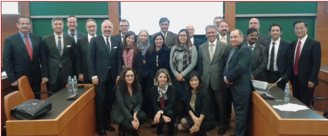
Workshop UNECE, 18/11/2015

Barcelona, 18 de noviembre de 2015 Con la colaboración de Naciones Unidas