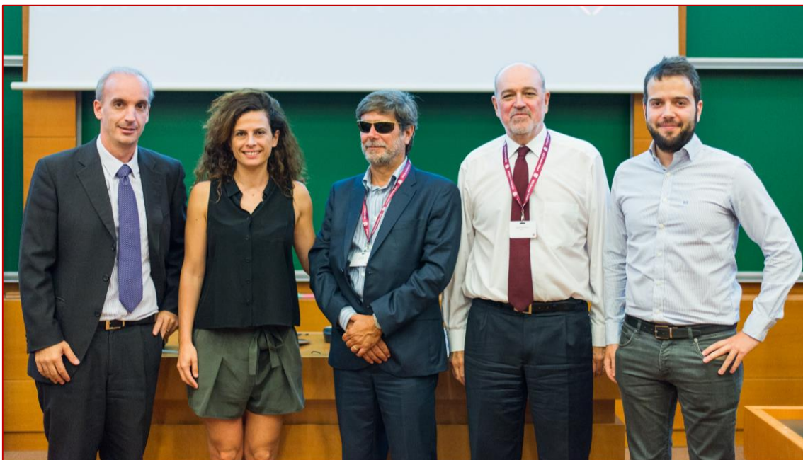
XV Coloquio PPSRC, 22/06/2016