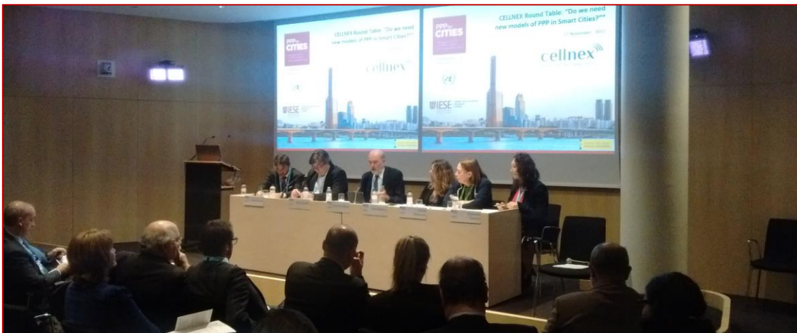
I Conference PPP for Cities, 17/11/2015

Barcelona, 17 de noviembre de 2015 Conferencia organizada en el marco del Smart City Expo World Congress