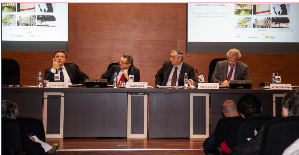
Presentación V Reform Monitor PPSRC, 14/04/2016