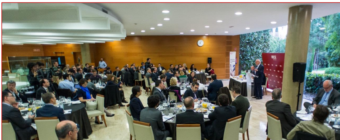
Desayuno-coloquio PPSRC, 4/04/2016