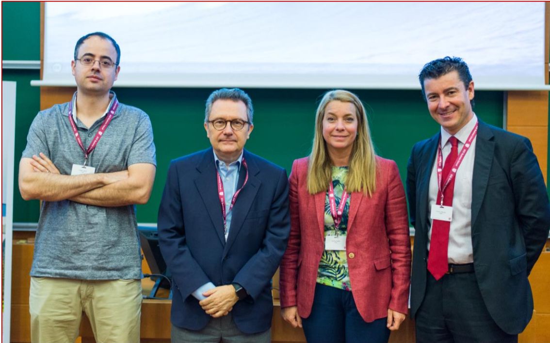
XV Coloquio PPSRC, 22/06/2016