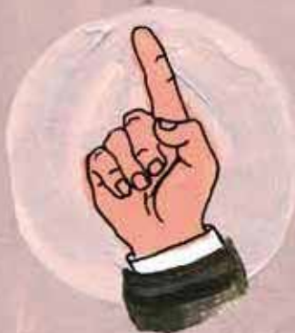
2 Razonamiento claro