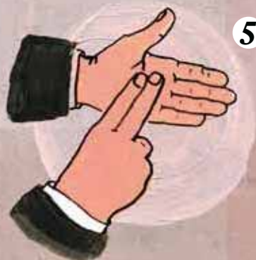
5 Tener opinión propia