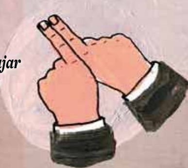
4 Trabajar juntos