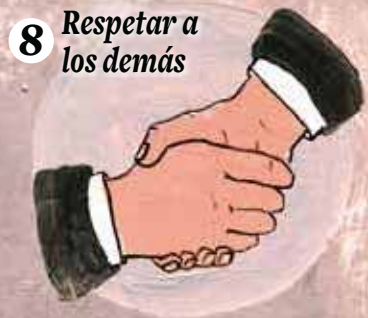
8 Respetar a los demás