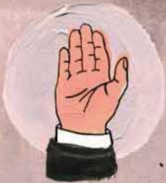
1 Ser honesto