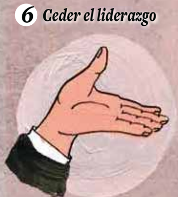
6 Ceder el liderazgo