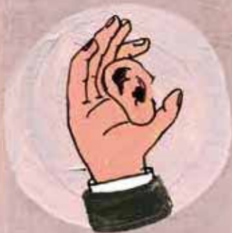
3 Escuchar a los demás